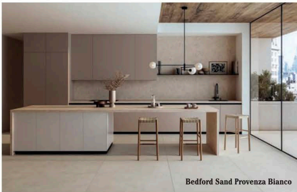
Bedford Sand Provenza Bianco

Bedford se beneficia de todas las propiedades técnicas que caracterizan al gres extruido: mayor densidad, alta resistencia mecánica y menor absorción de agua, lo que la convierte en una solución ideal para espacios exigentes en términos de durabilidad, seguridad y estabilidad dimensional. Esta tecnología permite además desarrollar piezas especiales con geometrías complejas y acabados específicos que garantizan una perfecta continuidad estética y funcional en proyectos integrales.